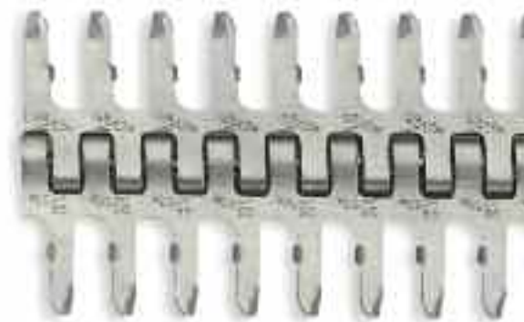
Соединения Alligator® Lacing размера 65