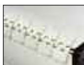
Крепления с пластмассовыми заклепками Alligator® Стр. 14–15